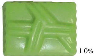
KCグリーン CO-57 (ベニバナ黄色素 +クチナシ青色素)