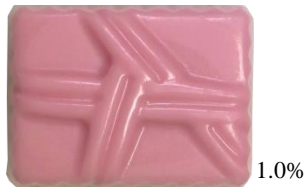
KCレッド BO-5 (アカビート色素)