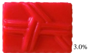
KCレッド ZO-3 (食用赤色102号)