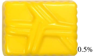
KCオレンジ YO-5 (パーム油カロチン)