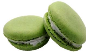
⑩KCグリーン CG-1 (クチナシ黄色素+クチナシ青色素)