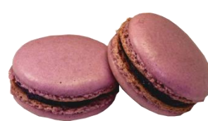
⑪KCバイオレット No.3 (クチナシ青色素+ラック色素)