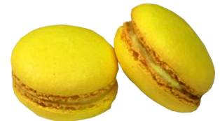
⑧KCイエロー KL-10A (クチナシ黄色素)