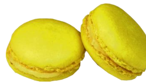
⑦KCイエロー No.3A (ベニバナ黄色素)