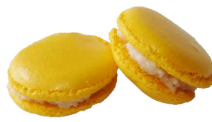
⑥KCオレンジ BE-15 (β-カロチン)