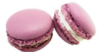
⑫*KCバイオレット KL-14 (クチナシ赤色素+クチナシ青色素)