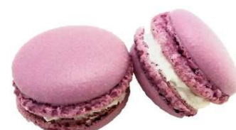
⑫*KCバイオレット KL-14 (クチナシ赤色素+クチナシ青色素)