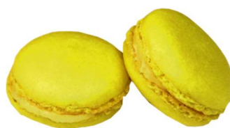
⑦KCイエロー No.3A (ベニバナ黄色素)