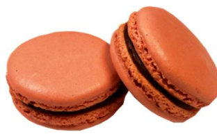
③KCレッド MR-20 (ベニコウジ色素)