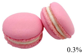
①KCレッド K-40 (コチニール色素)