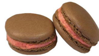
⑯KCブラウン SP-3 (カカオ色素)