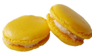
⑥KCオレンジ BE-15 (β-カロチン)