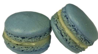
⑬KCブルー No.5P (クチナシ青色素)