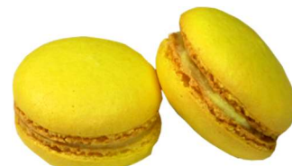
⑧KCイエロー KL-10A (クチナシ黄色素)