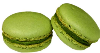
⑨KCグリーン CL-20 (ベニバナ黄色素+クチナシ青色素)