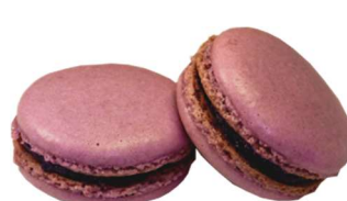
⑪KCバイオレット No.3 (クチナシ青色素+ラック色素)