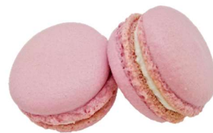
④KCレッド KL-7 (クチナシ赤色素)