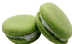
⑩KCグリーン CG-1 (クチナシ黄色素+クチナシ青色素)