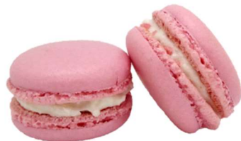
②KCレッド L (ラック色素)