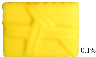
*KCイエロー GO-5 (マリーゴールド色素)