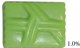
*KCグリーン CO-57 (ベニバナ黄色素 +クチナシ青色素)