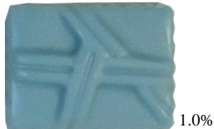
*KCブルー KO-10 (クチナシ青色素)