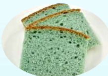
KCブルーKB-6添加量0.3% KCグリーンCL-20添加量0.03%